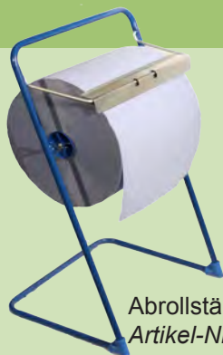
Abrollständer Artikel-Nr.: 8100027